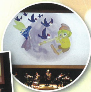
*写真は、他会場での公演のものです。