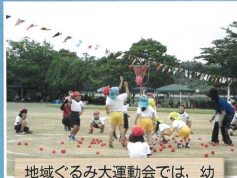
地域ぐるみ大運動会では、幼稚園児・地域の人と一緒に参加します。準備や運営は地域の人と協力して行います。