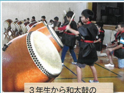
3年生から和太鼓の授業があります。 公開などで発表します。