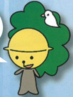
弥富小・幼キャラクター 「やっとみー」

自然が多く 地域の方々もとても親切 で学区外からの登校でも すぐに溶け込めます。