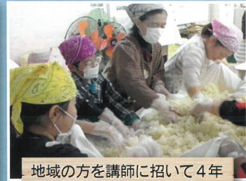
地域の方を講師に招いて4年生は味噌作りをします。出来上がった味噌は1年後、給食に出されます。