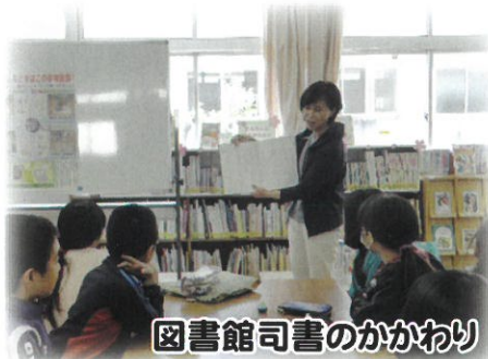
図書館司書のかかわり